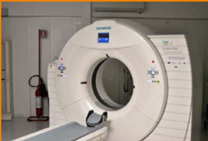
La TAC dell'Umberto I acquistata con i fondi Po Fesr