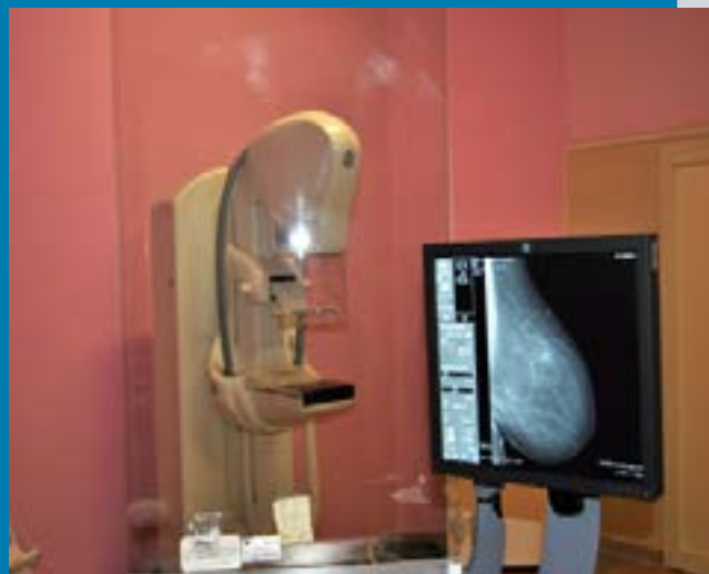
Mammografo Ospedale Rizza acquistato con fondi PO FESR 2007-2013

Controllo della documentazione sanitaria delle case di cura tramite i NOC (Nuclei Operativi di Controllo) e relativa gestione del contenzioso Gestione della liquidazione delle competenze alle case di cura Gestione del flusso A (sia dal punto di vista informatico che sanitario) per il controllo di DRG anomali, SDO incongruenti, ecc. Monitoraggio dei flussi informativi riguardanti le case di cura e i presidi ospedalieri (mobilità attiva e passiva, mobilità intra Asp, produzione economica, modelli HSP per i posti letto ospedalieri, ecc.) Monitoraggio di alcuni obiettivi assegnati alla Direzione Aziendale per le case di cura e i presidi ospedalieri (Piano Nazionale Esiti: frattura di femore, IMA STEMI, parti cesarei e colecistectomie laparoscopiche - Abbattimento delle prestazioni in DH e in Day Service - Indicatori dei punti nascita) Gestione della liquidazione delle competenze ai soggetti di cui al punto immediatamente precedente.