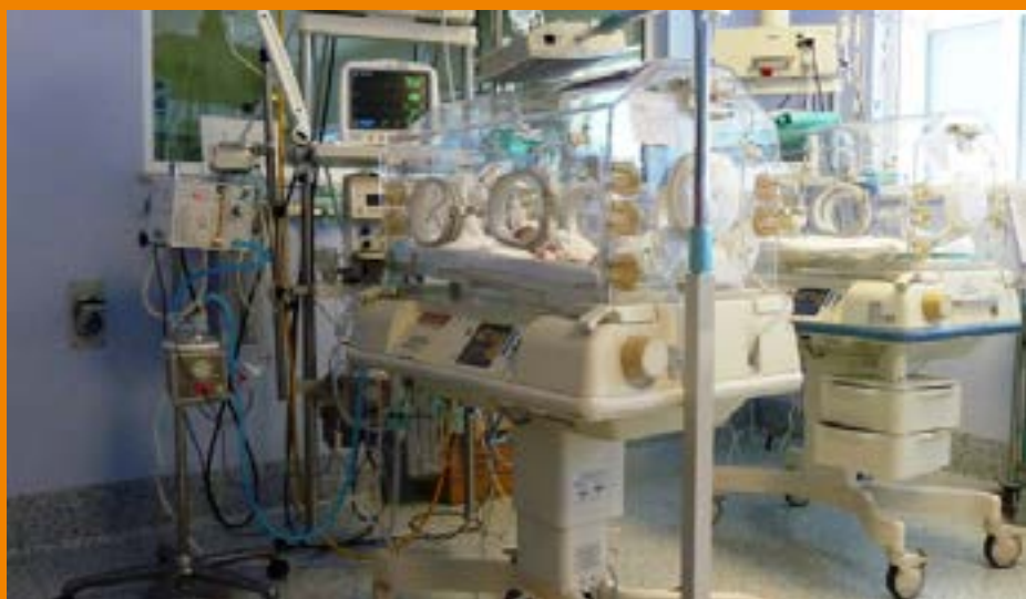
Unità di terapia intensiva neonatale Umberto I