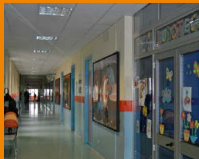
Uno dei Reparti di Pediatria dell'Asp di Siracusa