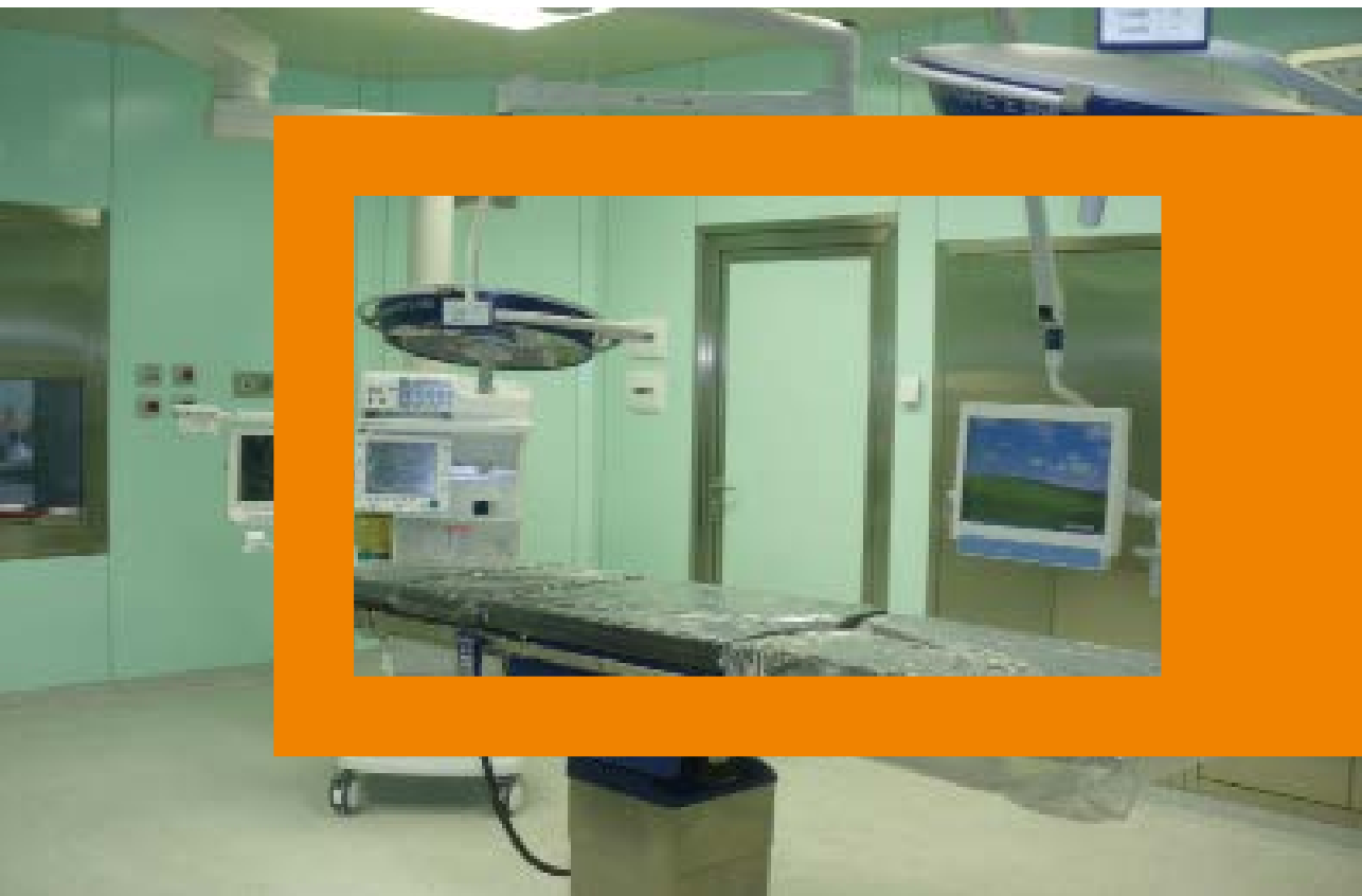
Sala chirurgica Ospedale di Lentini