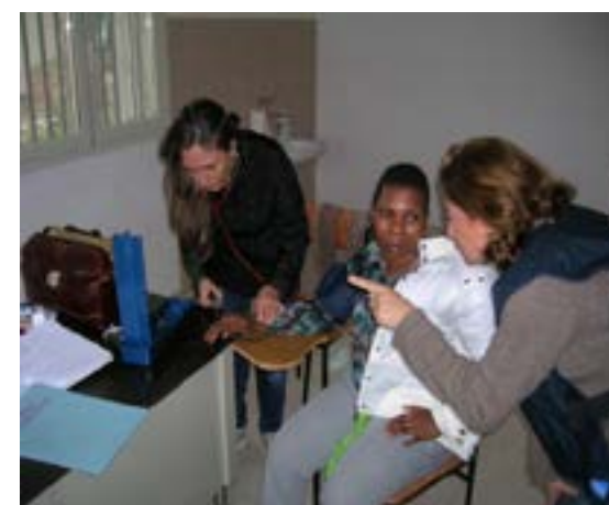
Un ambulatorio dell'ASP presso i centri di accoglienza straordinari per migranti.