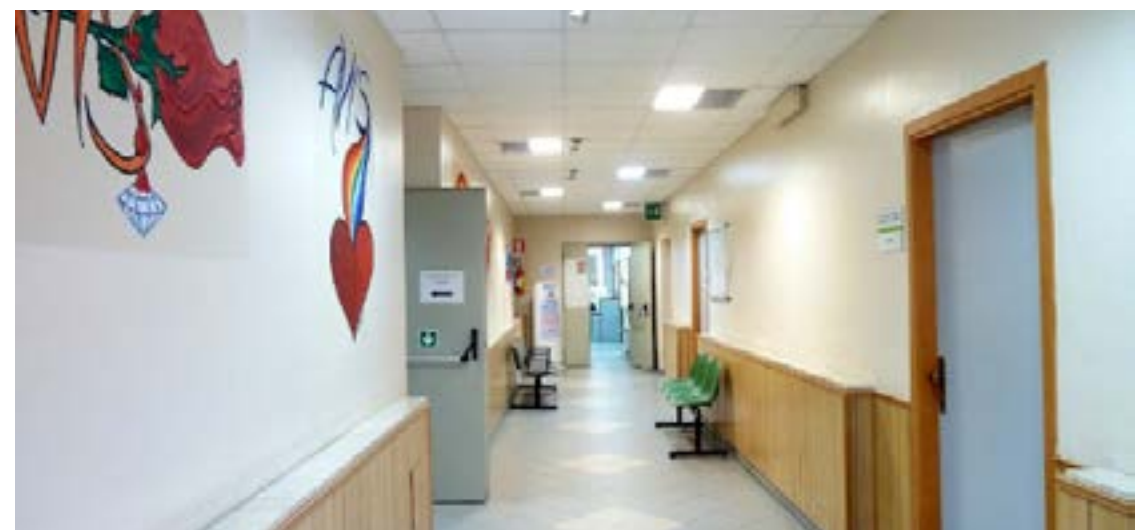
La sede dell'AVIS dell'Umberto I

PORTOPALO VIA STURZO, 17 - TEL. 0931 890851 CENTRO PRELIEVI