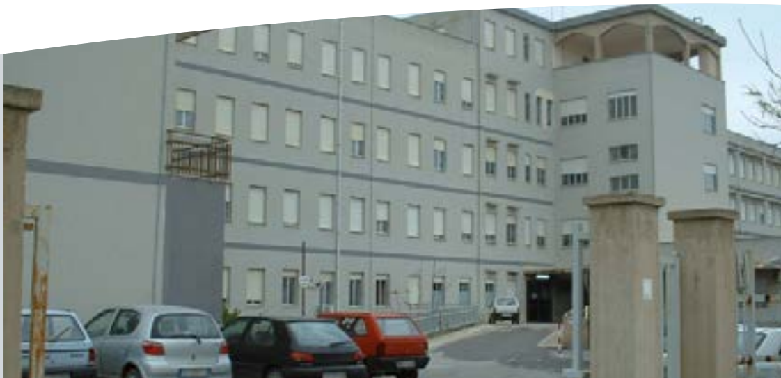
PTE di Pachino

Nei casi in cui fossero necessari i cosiddetti "farmaci innovativi"(Legge 23 dicembre 1996, n. 648) o i farmaci con distribuzione diretta bisogna innanzitutto rivolgersi agli sportelli ASB per la eventuale autorizzazione e poi ritirare i suddetti farmaci presso le farmacie territoriali ed ospedaliere come tabelle.