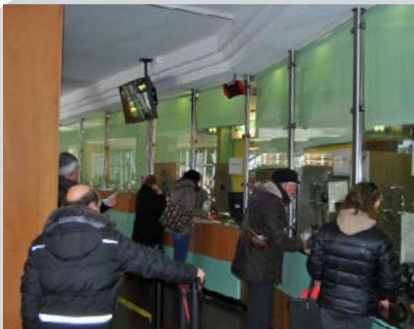
Il CUP dell'Umberto I