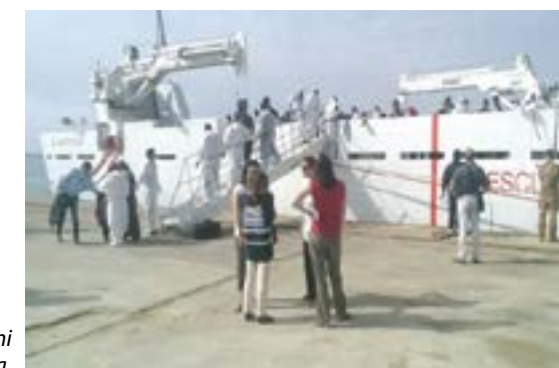
Uno dei numerosi sbarchi nella provincia aretusea.