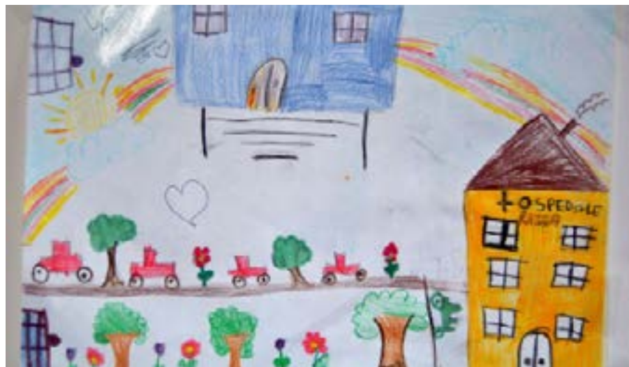
Disegno realizzato dai bambini dell'Unità operativa di Neuropsichiatria dell'Infanzia e dell'Adolescenza dell'Asp di Siracusa

I dati relativi a giorni e orari di accesso al pubblico possono essere soggetti a variazione.