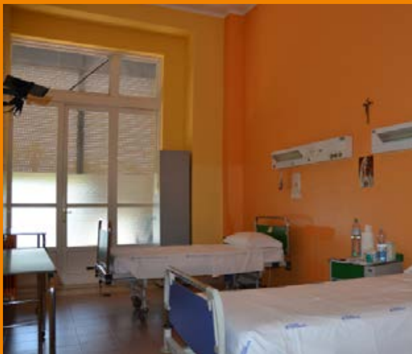
Hospice Ospedale Rizza Siracusa

Nella sezione TEMPI DI ATTESA > PRESTAZIONI del nostro sito internet www.asp.sr.it sono riportati in ordine alfabetico i tempi di attesa, in attuazione del decreto dell'Assessorato regionale della Salute del 2 luglio 2008, relativi alle prestazioni sanitarie erogate, distinte per strutture territoriali e ospedaliere di competenza.