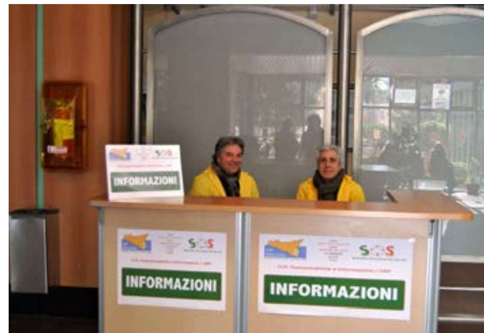
Lo Sportello S.O.S.