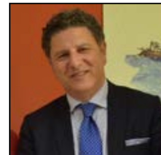
Direttore Generale Salvatore Lucio Ficarra

Il vertice dell'ASP di Siracusa è rappresentato da: