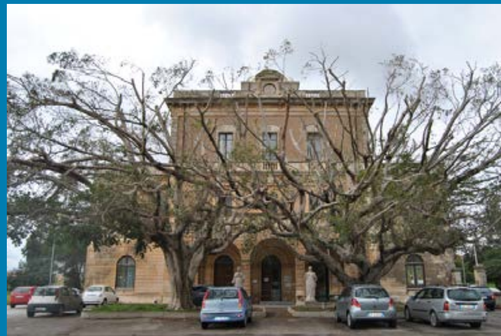
Alcune delle strutture dell'area ex Onp di traversa " La Pizzuta" a Siracusa