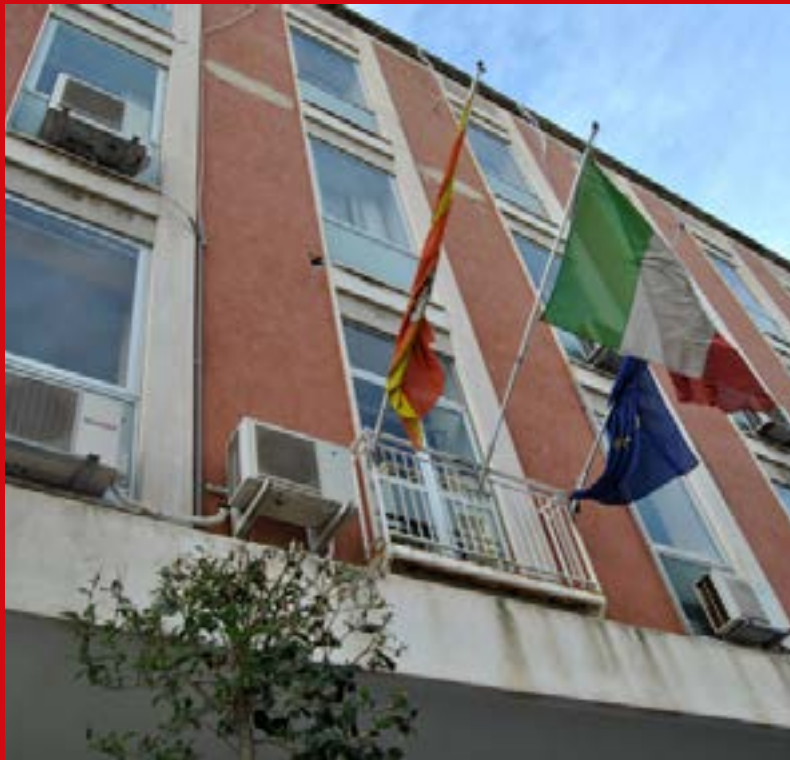
Sede dell'ASP in Corso Gelone a Siracusa