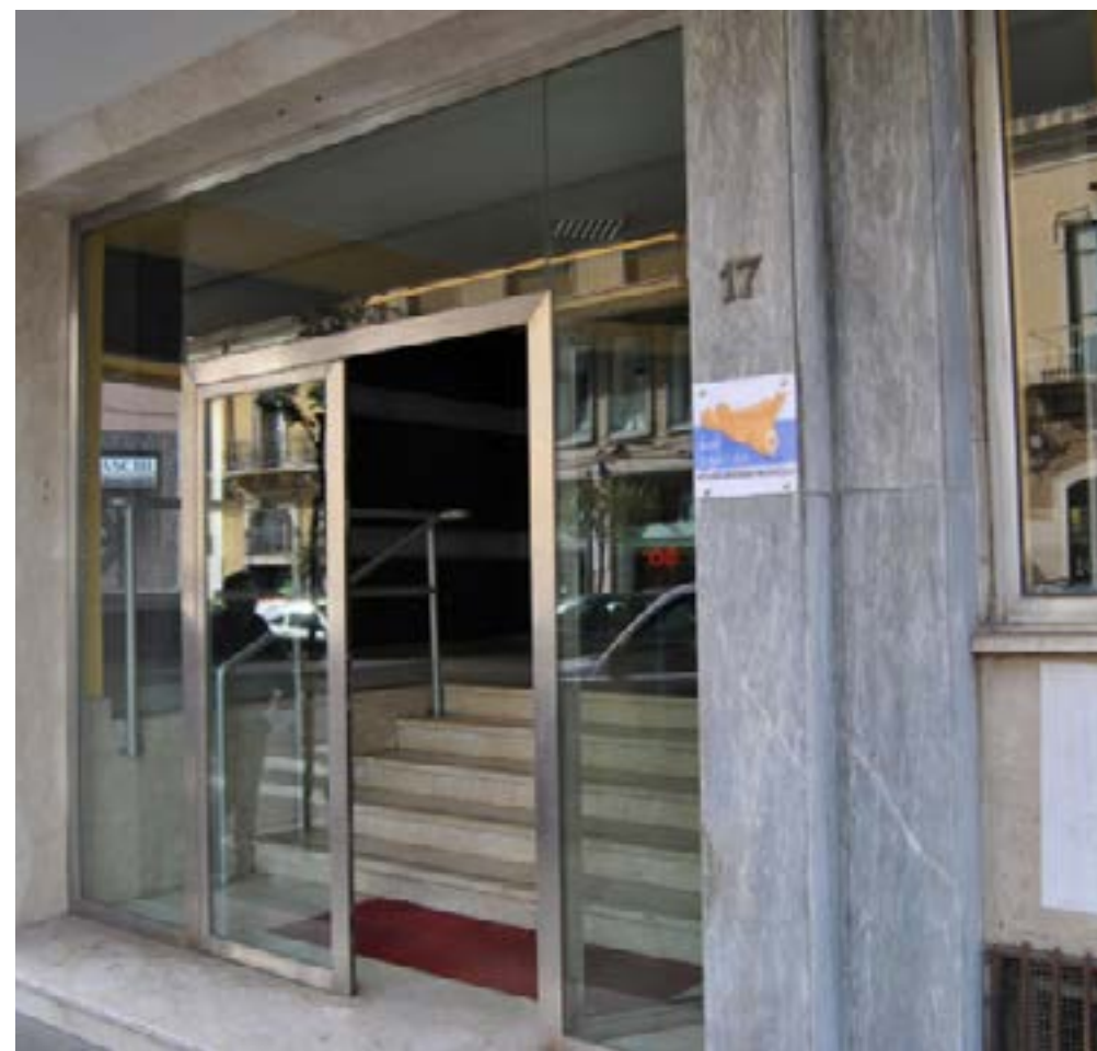
L'ingresso dell'Asp - Corso Gelone

L'Area Ospedaliera comprende gli Ospedali di Siracusa, Noto- Avola, Augusta e Lentini