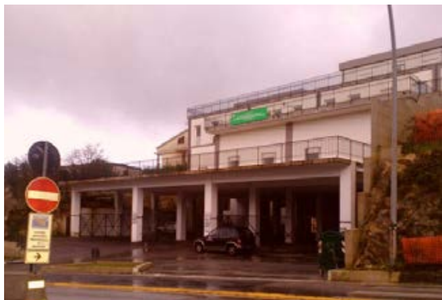
Il PTA di Palazzolo

Attività di medicina legale, fiscale e necroscopica.