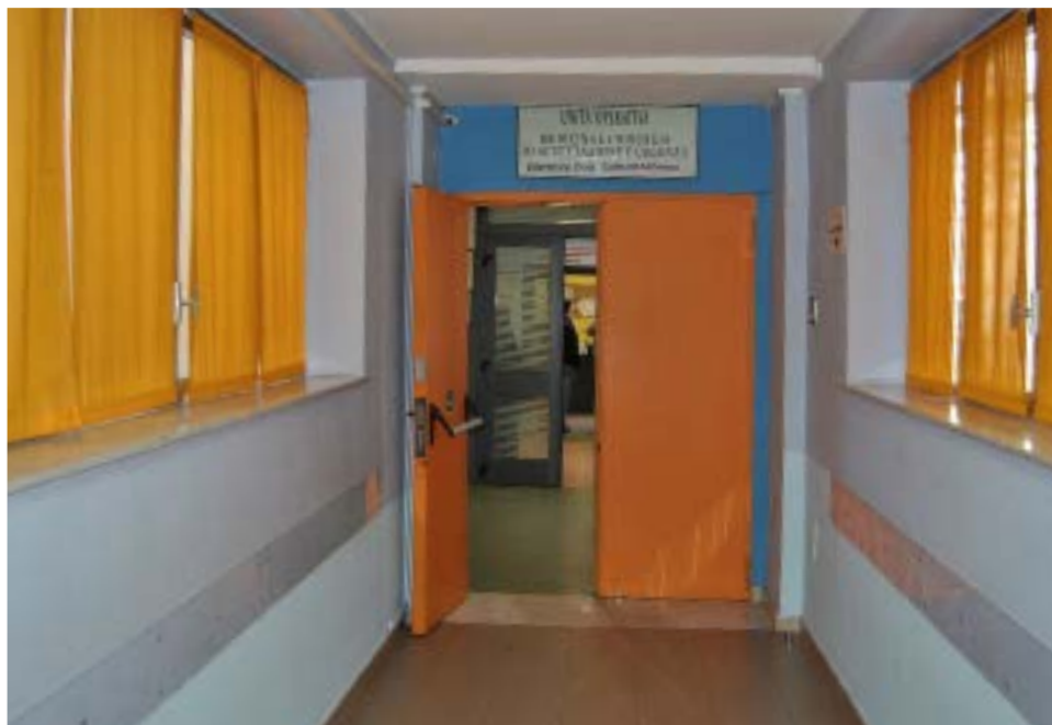
Pronto Soccorso Umberto I

L'ASP si impegna inoltre a verificare la qualità dei servizi forniti e ad elaborare periodicamente piani di miglioramento del livello qualitativo, perseguendo una politica trasparente d'innovazione dei servizi e di modernità delle tecnologie impiegate. Si impegna inoltre a razionalizzare, ridurre e semplificare le procedure di accesso ai servizi, di prenotazione delle prestazioni, di pagamento delle tariffe e di ritiro della documentazione sanitaria.