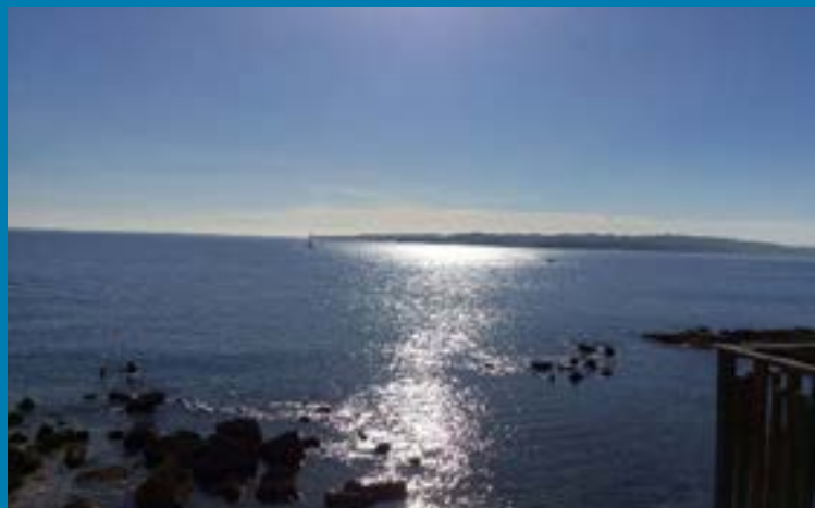
Forte Vigliena di Siracusa